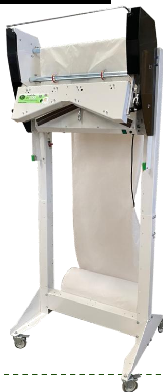
PP H600 B-P En el bastidor, cierre neumático