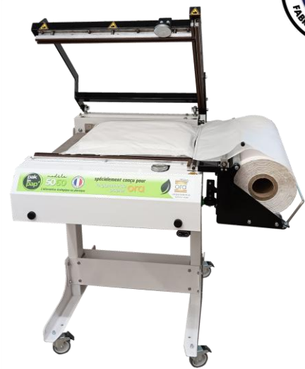
PP 5060 M-P cierre neumático + soporte con pies motorizadas (opción)