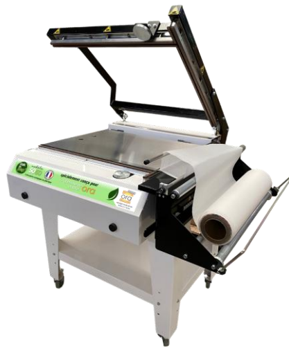
PP 5060 M Cierre manual