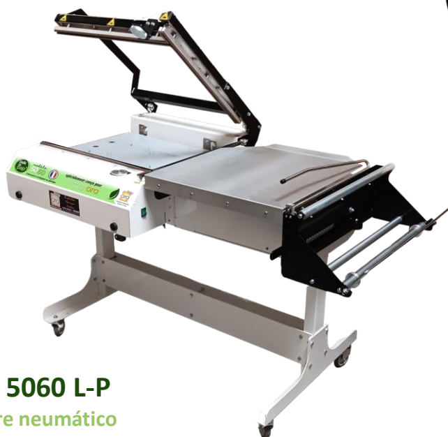
PP 5060 L-P cierre neumático + pies motorizados (opcional)