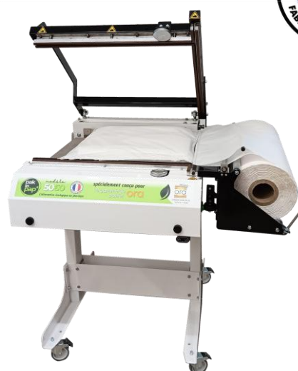
PP 5060 M-P cierre neumático