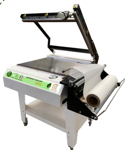
PP 5060 M Cierre manual